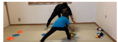
すばやくまねしよう