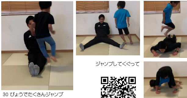
ジャンプしてくぐって