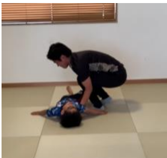
こどもハンバーグはひっくりかえされるな